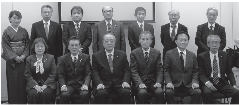
各団体からの出席者

11月13日、全国珠算教育団体連合会(珠算「エッサム神田ホール」)で開かれ、珠算三団体の役員等が出席した。