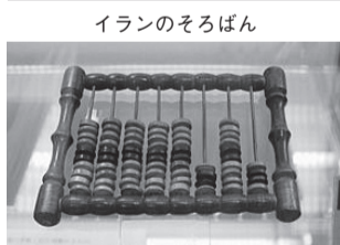
イランのそろばん