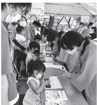
境内での大盛況なイベント