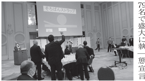
アトラクションの抽選会で和気あいあいと親睦