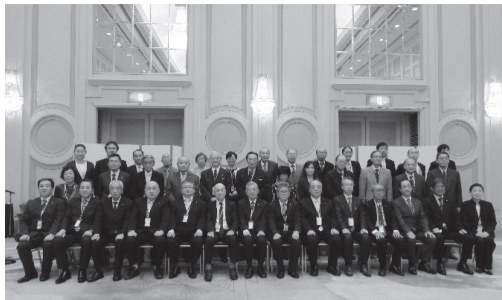
創立60周年を祝う参加者たち

10月10日、東京都支部創立60周年記念式典・祝賀会を、東京・台場にあるホテル「グランドニッコー東京台