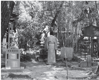
厳肅に神事を執り行う