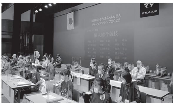
ステージ上で行われる決定戦・石巻市

2022の優勝決定戦が石巻市で開催され、小学3年生以下の部から中学・高校・一般の部まで宮城県内の珠算学習者が日頃の練習の成果を競い合いました。