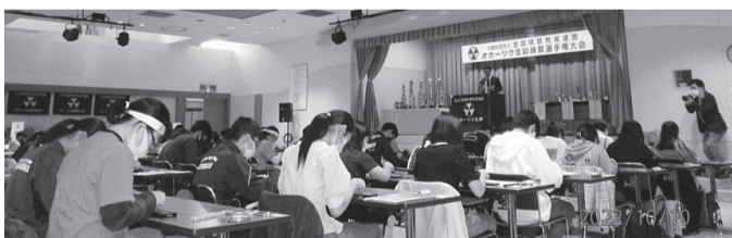
緊張感あふれる3年ぶりの一堂に会しての大会