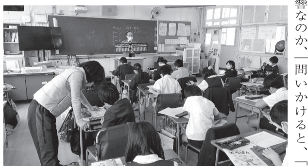
「そろばんが持つ計算の楽しさ」をアピール

ただ、生徒たちに「そろばんは楽しいな！」と思ってもらえるよう授業を進めています。ここ3年間はコロナ禍による影響なのか、学校によつては全くそろばんに触ろうとしない生徒も多々見受けられ、大変やりにくいと感じることもあります。そんなときは読