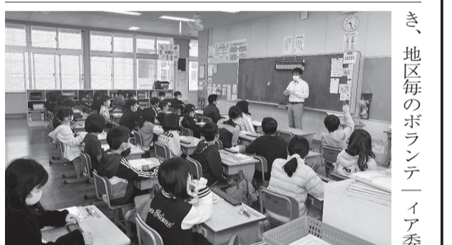
大きな桁数の計算にも挑戦

沖縄県では、コロナ禍の影響が懸念される中、昨年7月から本年3月までに92校の小学校から依頼を受け、そろばんボランティア授業を実施した。例年、小学校側より窓口である当支部に依頼書が届