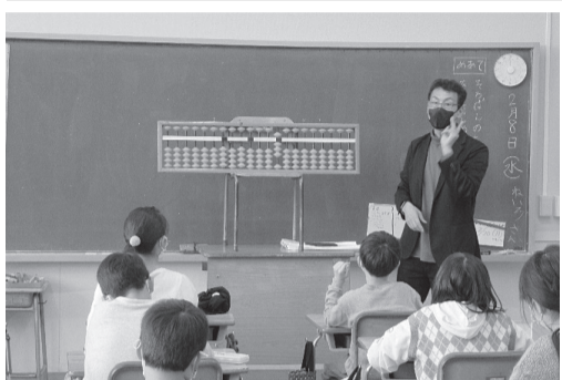
みんなで一緒に弾く楽しい授業

最初にボランティア授業の依頼を受けてから13年になる。近年は学年末に3・4年生各2クラスと「学び（個人指導専門）」クラスの全5クラスを各2時間授業という依頼を受けている。 たった2限の授業で初歩を全て指導するのはそもそも無理、詰め