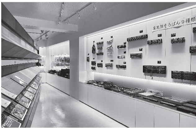
日本そろばん資料館 (東京都台東区)

日本の伝統文化としての珠算教育資料を展示し、そろばんの魅力伝える「日本そろばん資料館」のホームページが、4月27日に開設された。同ホームページでは、そろばんの歴史をまとめた年表の掲載や、イベント情報の告知のほか、メディアプラッ