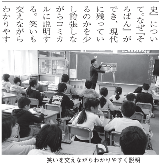
笑いを交えながらわかりやすく説明

東京都では、今年度も554校と多くの小学校から出講依頼があった。 私も約30校の小学校へ出講しそろばん授業を行ってきたが、その中で毎回心がけている点